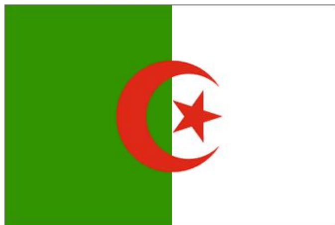
图 2 阿尔及利亚国旗

截至 2019 年，阿尔及利亚总人口约 4305.31 万，其中阿拉伯人约占总人口的 80%，柏柏尔人约占总人口的 20%。人口与经济主要集中在阿尔及利亚北部沿海地区。