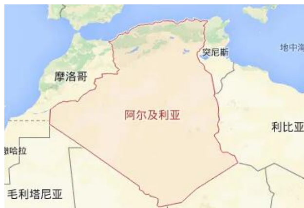
图 1 阿尔及利亚地图

阿尔及利亚位于非洲西北部，陆地面积 238.17 万平方公里，居非洲、地中海和阿拉伯国家之冠，排全球第 10 位。